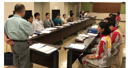
日赤救護班から医師会救護班への引き継ぎ式

医療支援活動の終了後は、呉市医師会に呉市行政、広島県西部保健所、災害拠点病院救護班、呉精神科医会、呉市医師会で構成する「災害合同復興会議」を設置し、適宜開催して関係者間の情報共有を図っています。