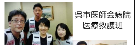
呉市医師会病院医療救護班