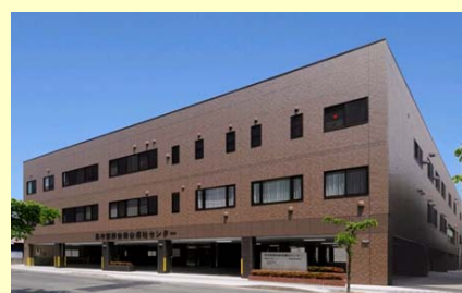
呉市医師会総合福祉センター