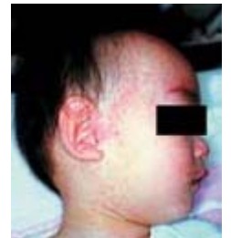
顔面にみられる発疹

麻しんは予防接種の普及により国内由来のものは見られなくなりましたが、海外から持ち込まれると流行します。特効薬はなく、約3割で肺炎や脳炎などの合併症がみられ、致死率も0.1～0.2%とされています。特に脳炎の致死率は15%と高く、回復しても中枢神経系の後遺症を残すことも少なくありません。初期には、かぜと区別がつきにくく、感染力も強いので、注意が必要な病気です。