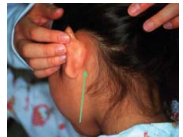
耳介後部リンパ節の腫脹が見られる

風しんも自然治癒する病気ですが、妊娠初期の女性がかかると、生まれてくる子どもに心疾患や発達の遅れなど様々な症状（先天性風しん症候群）が出る可能性があります。