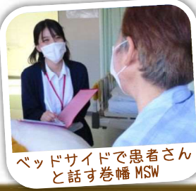
ベッドサイドで患者さんと話す巻幡MSW