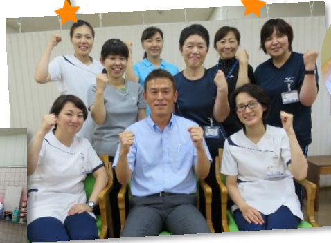
私たちと楽しく レッツリハビリ♪