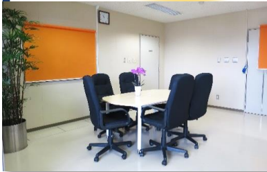
副院長・統括部長室の様子

これまでには一日の大半を看護部のために費やしてきましたが、今後は呉市医師会全体の管理をしていくために、介護の勉強にも励んでいるところです。また、3階の血管撮影操作室を改装し、副院長・統括部長室を作っていただきました。病院に来られた際には是非お立ち寄りください。