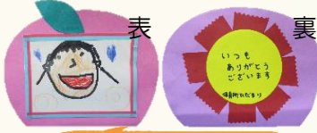
写真立てのプレゼント

9月14日(金)、呉市医師会総合介護センター内のテイクアあさひにて『敬老会』が開催されました。院内保育所ひだまりの子どもたちによる「とんぼのめがね」や「月」の合唱と、写真立ての可愛いプレゼントがありました。そのお礼にと利用者さんの一人がハーモニカで「春の小川」を演奏され、自然に他の利用者さんや職員の歌声が会場内に響き渡りました。はじめは緊張していた子どもたちもその和やかな雰囲気にも包まれ、さらに笑顔の輪が広がり、みんなで楽しい時間を過ごすことができました。